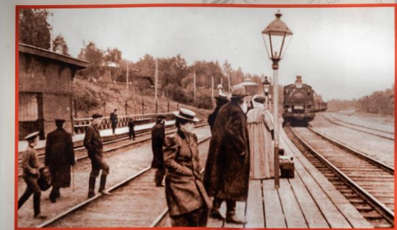
Лев Толстой в ожидании поезда

Вы узнаете, почему роковой последний маршрут Льва Толстого прервался именно в Астапово, Как ушел Гений, а вместе с ним и целая эпоха. Мы узнаем много новой информации о тех, кто стал свидетелями смерти писателя и сыграл огромную роль в сохранении светлой памяти о нем. Мы увидим потрясающий пример возрожденного комплекса железнодорожной станции, познакомимся с ее историей и современностью, а также – узнаем, чем живет сегодня липецкий поселок, названный в честь одного из самых величайших писателей в мире.